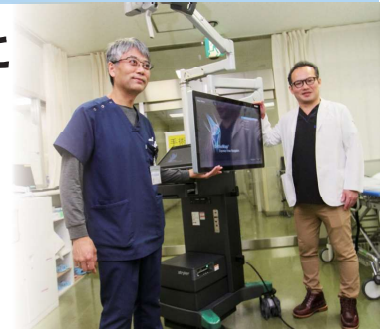
関節外科手術用のコンピュータナビゲーションシステム。こちらの画面を確認しながら手術を行います。

POINT 当院の整形外科には7名の医師が在籍しており、診断から治療までより専門的な診療にあっております。