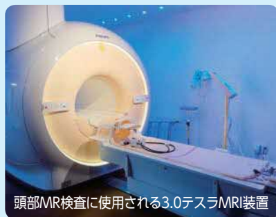
頭部MR検査に使用される3.0テスラMRI装置