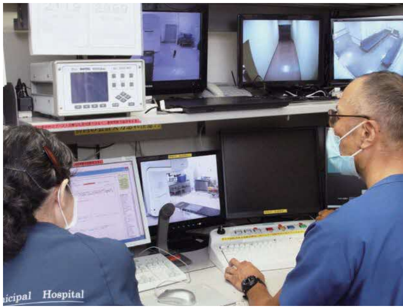
放射線治療システムは治療室の操作ブースから遠隔操作します。

悪性腫瘍(がん)の三大治療法は、手術、抗がん剤を使う化学療法、そして、放射線治療といわれています。その中で放射線治療は外科手術や抗がん剤治療が確立される前から行われている歴史のある治療法といえます。しかし、わが国では3割程度しか行われておらず、欧米に比べると非常に少ないのが現状です。その原因の一つに、放射線に対する正しい理解が進んでいないことが挙げられます。正しい理解のもとに安心して放射線治療を受けていただくために、茅ヶ崎市立病院の放射線治療について聞きました。