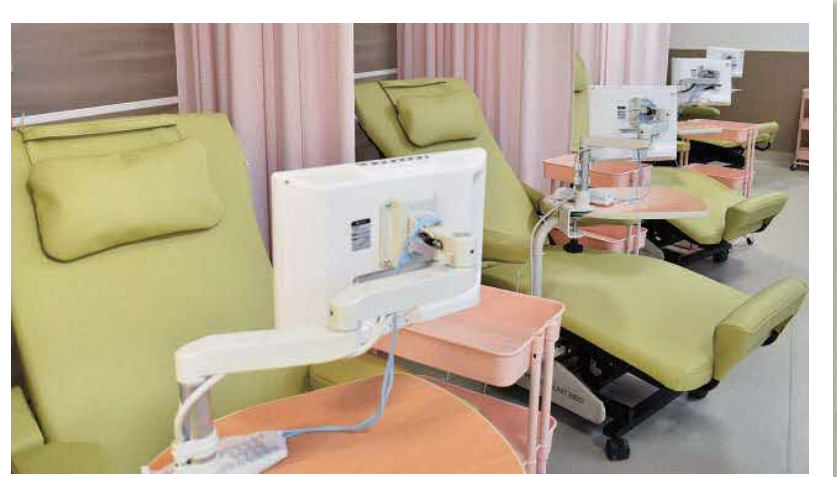
9床あるベッドにはテレビモニターを設置し、Wi-Fi環境も整え、治療を受ける患者さんが居心地よく過ごせるよう工夫しています。